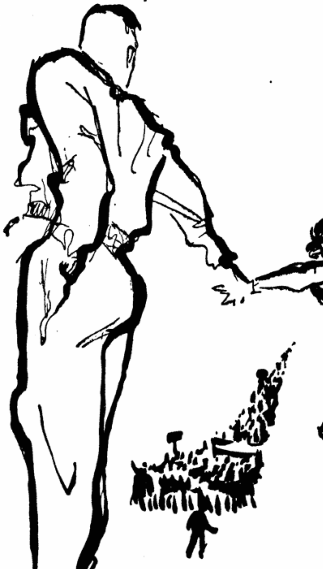
Париж и девушки кружатся вокруг колонны...