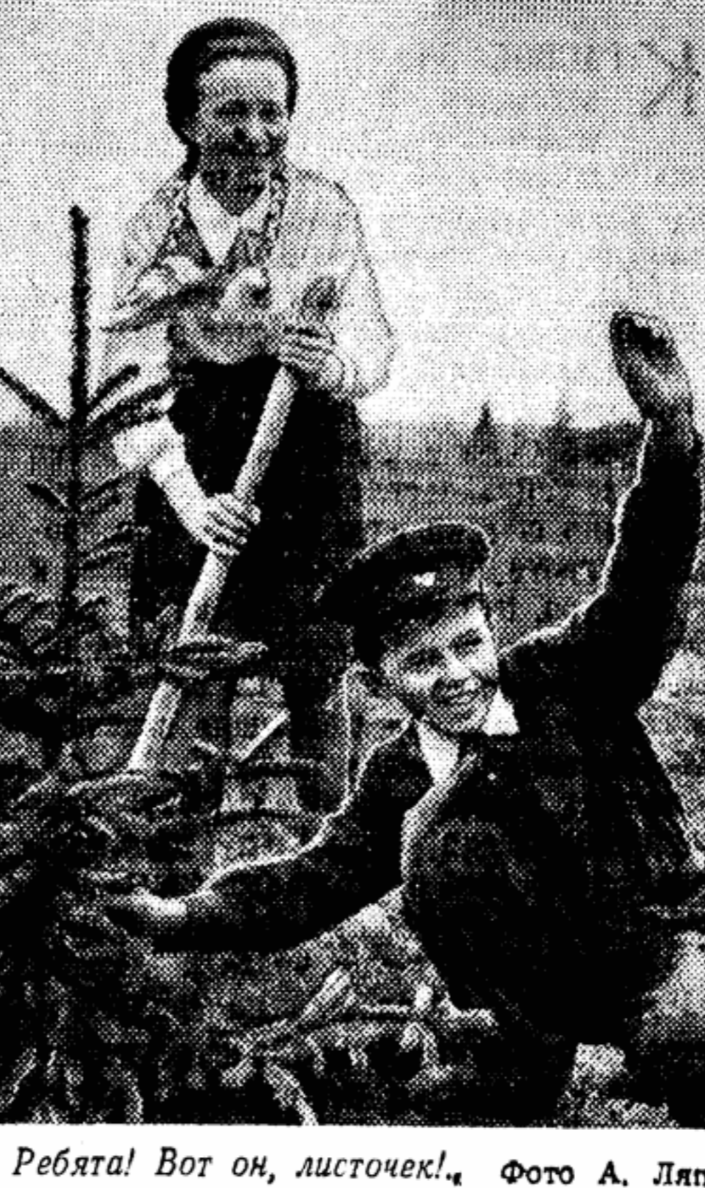
— Ребята! Вот он, листочек!

ТЕНЬ от зеленой листвы еще не ле- жит на дорожках, и лишь бугорки чернозема высятся у стволов, обгребая молодые деревья. И все-та- ки это уже парк. Самый сказочный парк на земле, зеленый заповедник всей планеты, посаженный девушками и юношами более чем ста стран мира. Неясный, робкий шорох слетает с де- ревьев юного парка в эти дни первой его весны. Разноголосый шепот бере- зок, тополей, дубков, каштанов, кленов, елей хорошо различает Дмитрий Ильич Афанасьев, мастер-садовод парка Друж- бы.