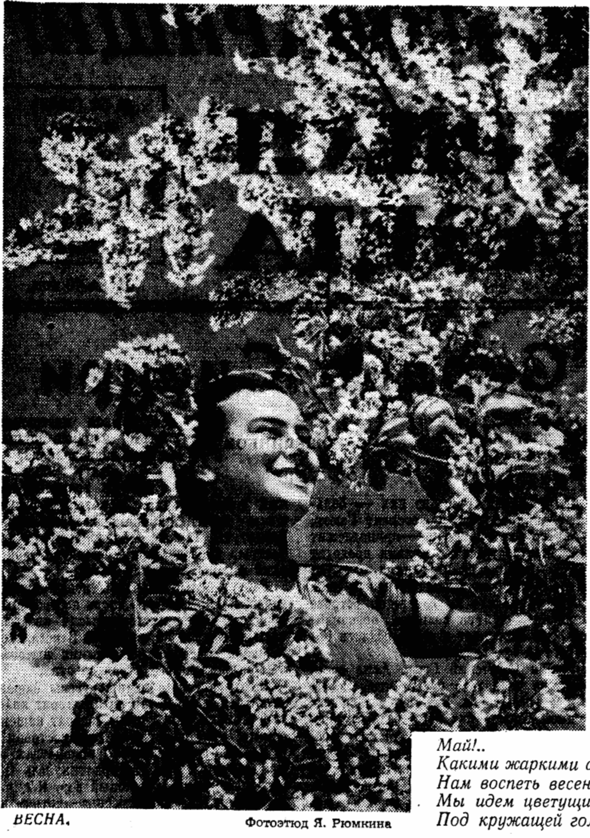
Май!.. Какими жаркими словами Нам воспеть весенний праздник твой? Мы идем цветущими садами, Под кружащей голову листвою.

Виктор УРИН ЦВЕТ ВРЕМЕНИ Кровь голубая и черная софия, банда зеленая, белая рать, — Ринулись все, чтобы красное наше, красное наше в могилу вогнать. Но в облаках, на земле или в море — Нет, никогда не урет этот цвет. Как не исчезнут багровые зори, алый восход, кумачовый рассвет. Красная Гвардия — красные банты, красные ленты — у партизан. Выбиты желто-бланные банды, Выброшен черный барон-атаман, Первые наши советские годы, трудная летопись новых времен: «Красный путиловец», «Красные всходы», «Красная нива», «Красный кордон», Год сорок первый, военное лето. Снова страну опалила беда: Черный десант, «Голубая дивизия», просто коричневая орда. Жадная нечисть развличного цвета Красное хочет стереть навсегда. Но не предвзят, Осидит это. Снова идут на годами года. Снова (о, как это миру знакомо!) — Вьется, как черт, полосатый галдеж: Черные списки из Белого дома, Желтая пресса и грязная ложь. Только ведь красное — это грядущее, не поборошь его, не задушишь. Судьбы народов прошла вудущая, Самая крепкая красная нить. Может, от бурь, от дождей и от пелла Вдруг мы заметим: немного поблекло, — Что же, возьмите тогда мою кровь! Только бы красное не увядало, Только бы вечно оно процветало... Красное знамя, Красный Октябрь, Красная площадь, Красная новь!