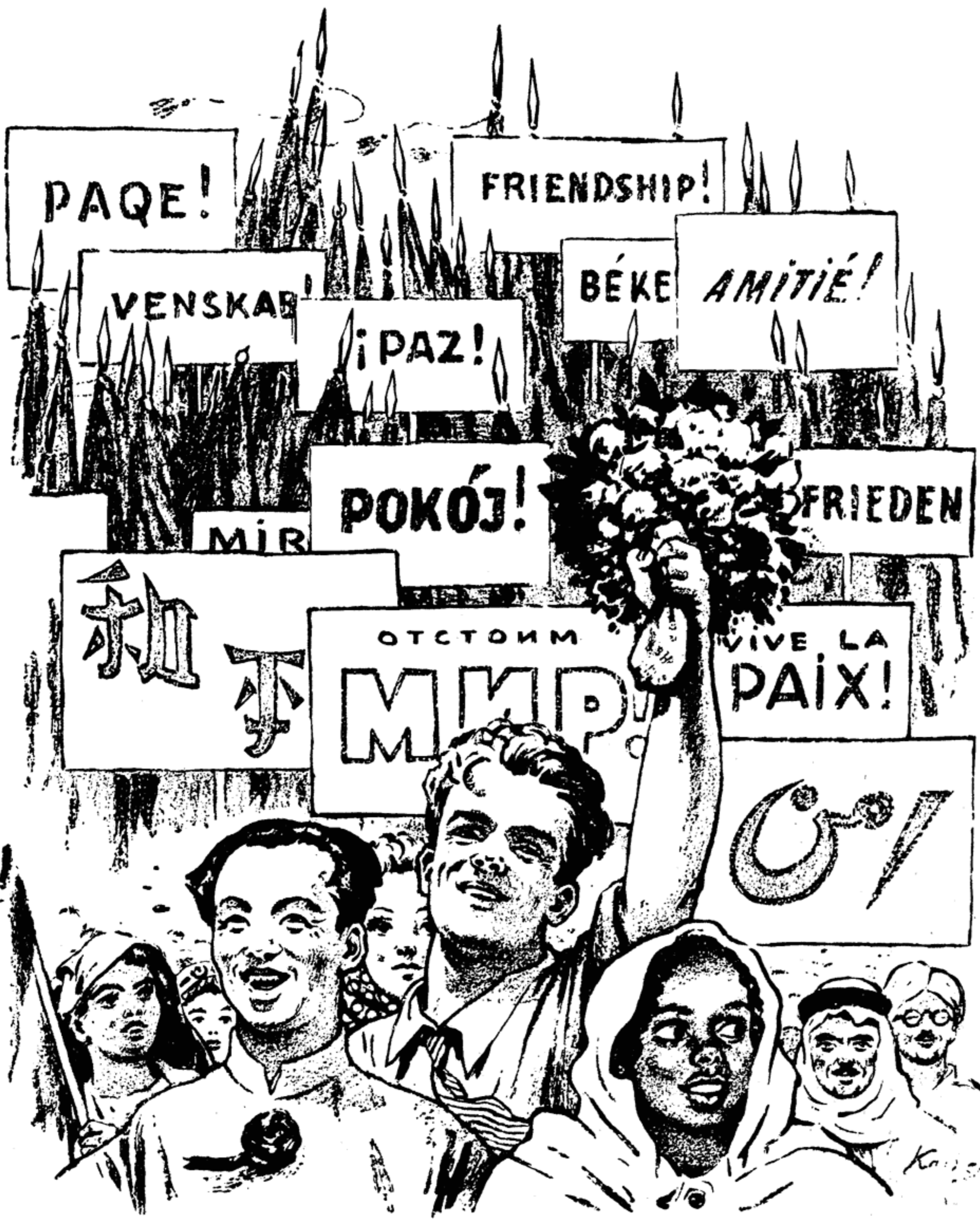
Рисунок Н. Карповского