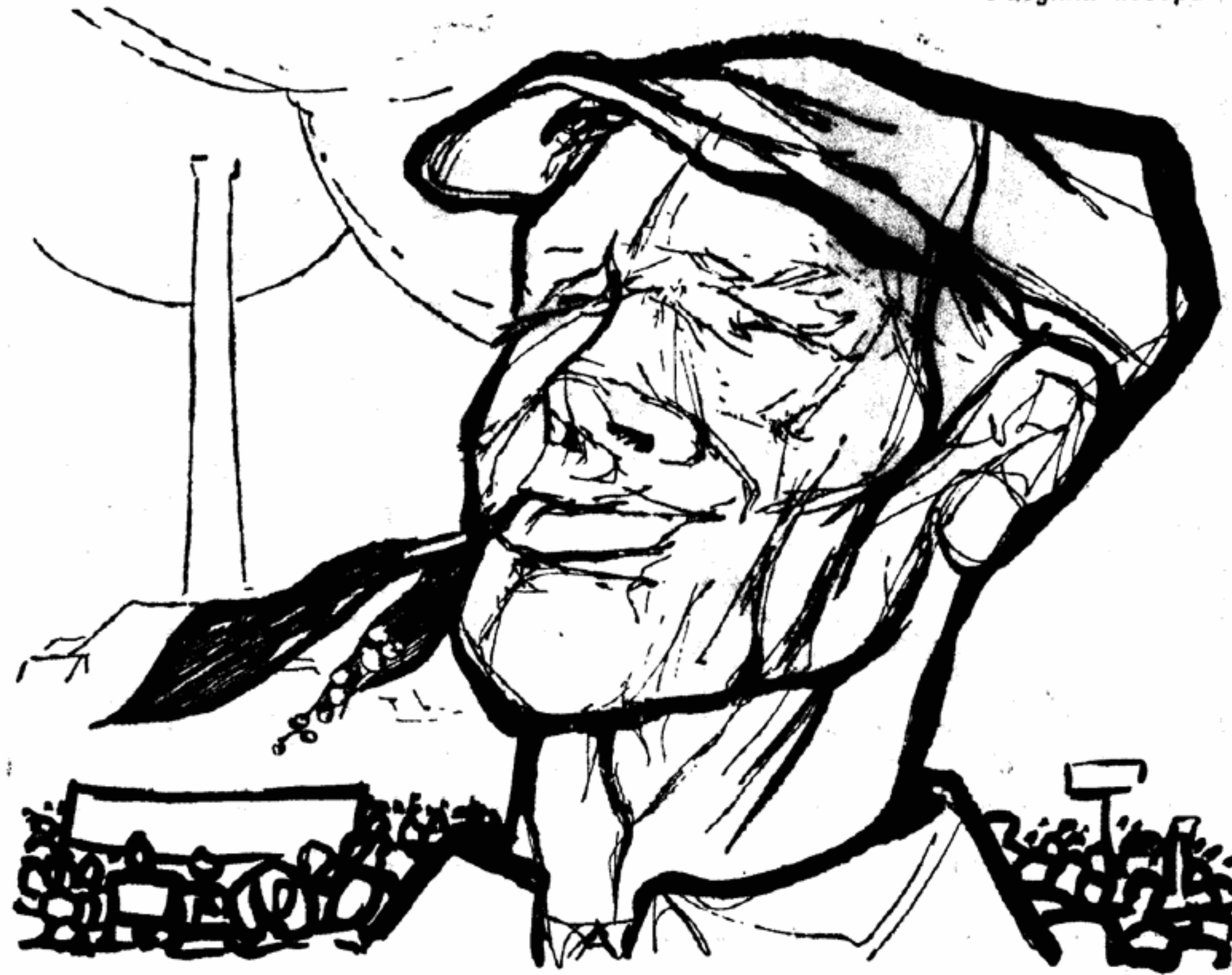
Сияние солнца, аромат ландышей усиливают ощущение праздника...